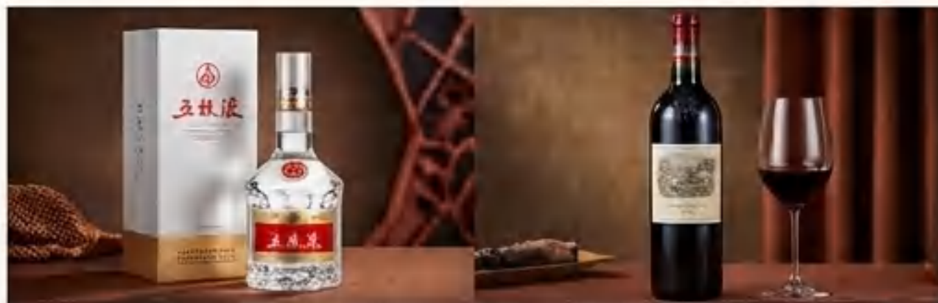
五粮液，拉菲·巴斯克