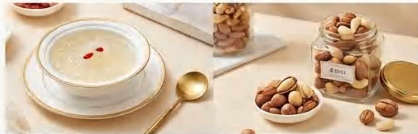
燕之屋，美荻斯坚果

无论是国宴名酒，还是时令进口鲜果，都旨在为每一个重要时刻增添一份难忘的味蕾记忆。