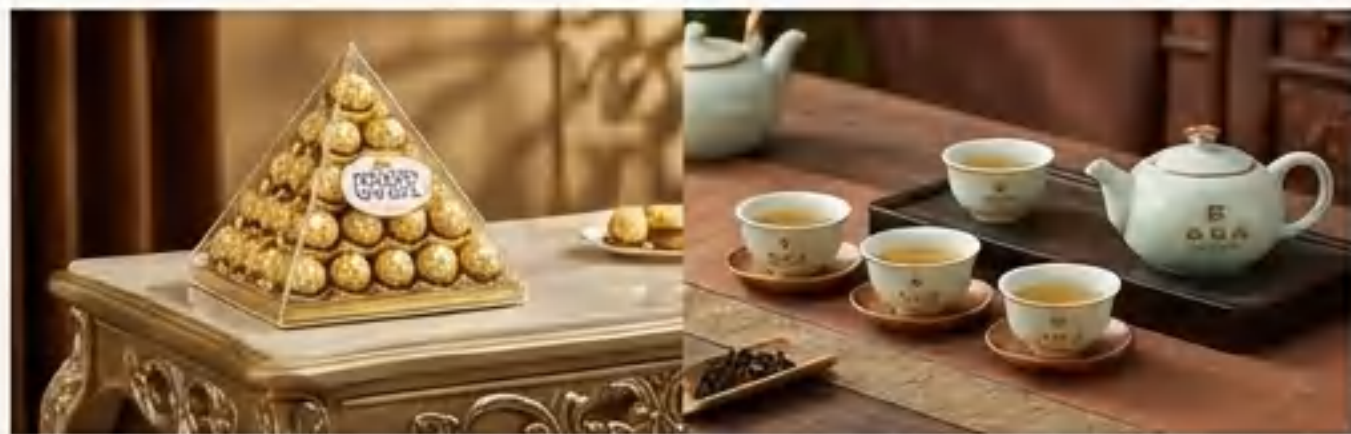
费列罗，华祥苑，天福号，月盛斋