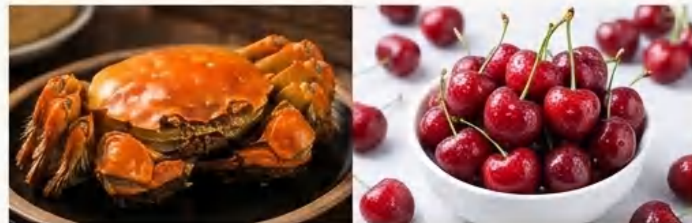
蟹状元，百果园，晓芹海参